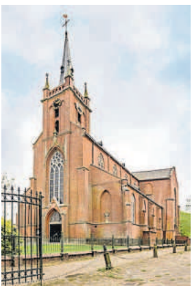
De Sint-Jacobus de Meerderekerk in Uithuizen.